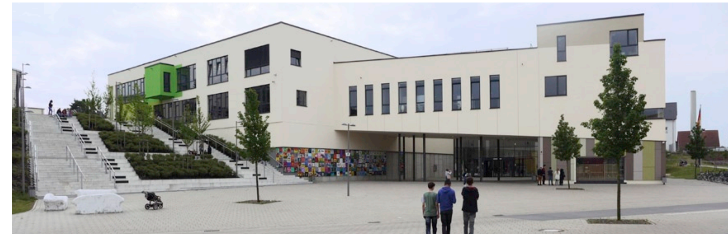
03 Campusplatz mit Lernhaus