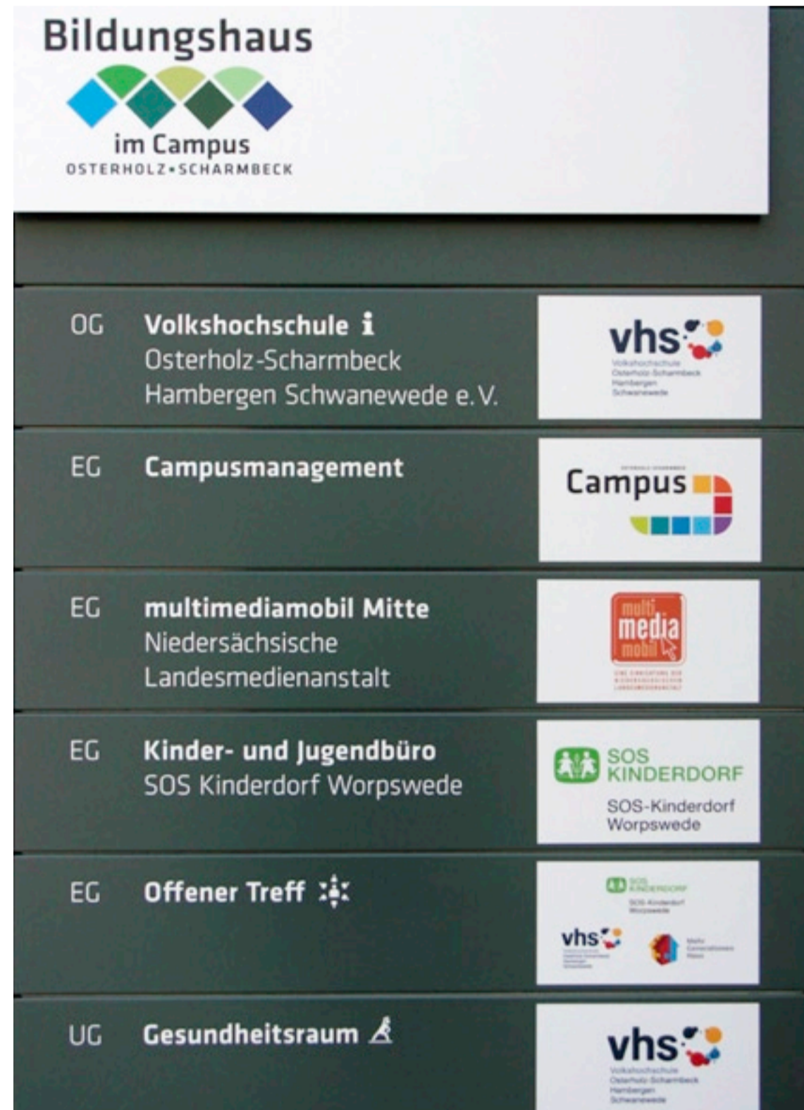
08 Offener Treff im Bildungshaus