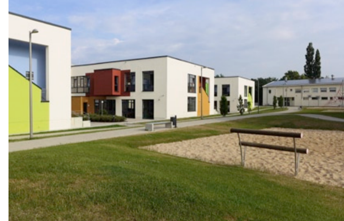
06 Lernhaus mit Innenhof

Planerin Stadt Osterholz-Scharmbeck, Büros: Kister Köln, trapez Hamburg, Kleberg Ritterhude, HBI Bremen In Zusammenarbeit mit Büros: Horeis Bremen, GIG Bremen, Carstensen Bremen, Storm Lillenthal Bauherrin Stadt Osterholz-Scharmbeck und ARGE Lernhaus OHZ im Auftrag der Stadt Osterholz-Scharmbeck