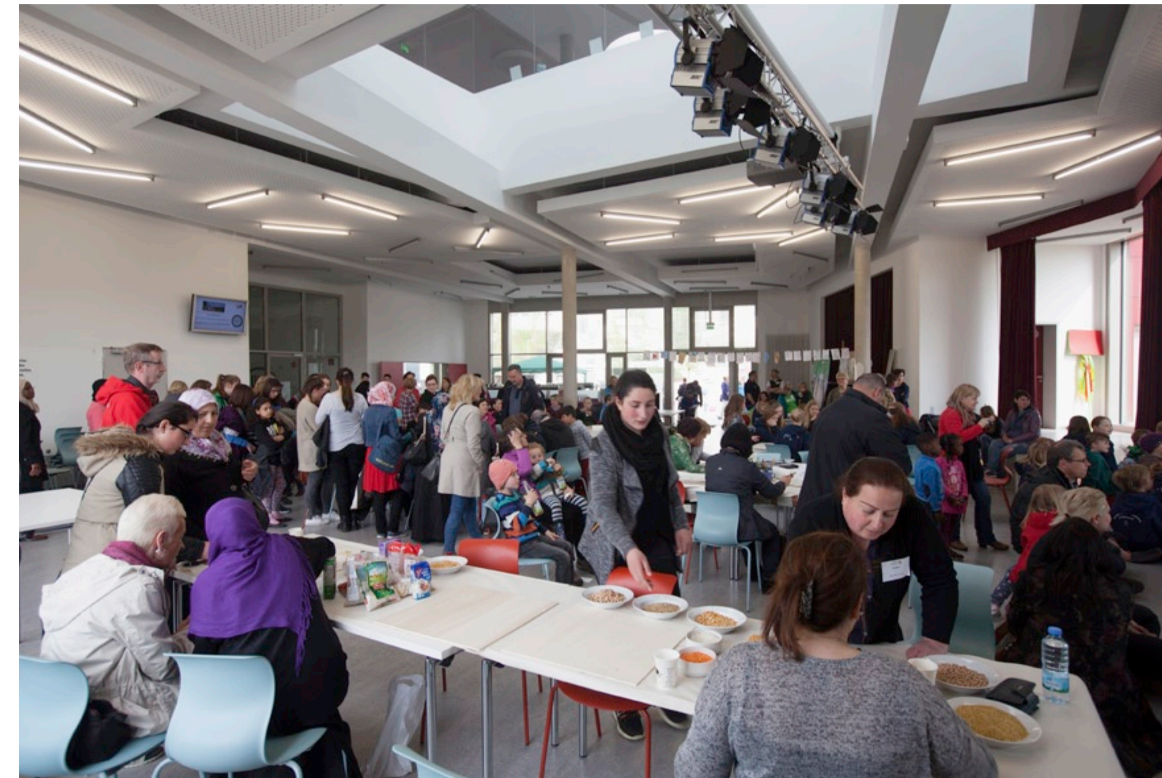
10 Fest der Vielfalt