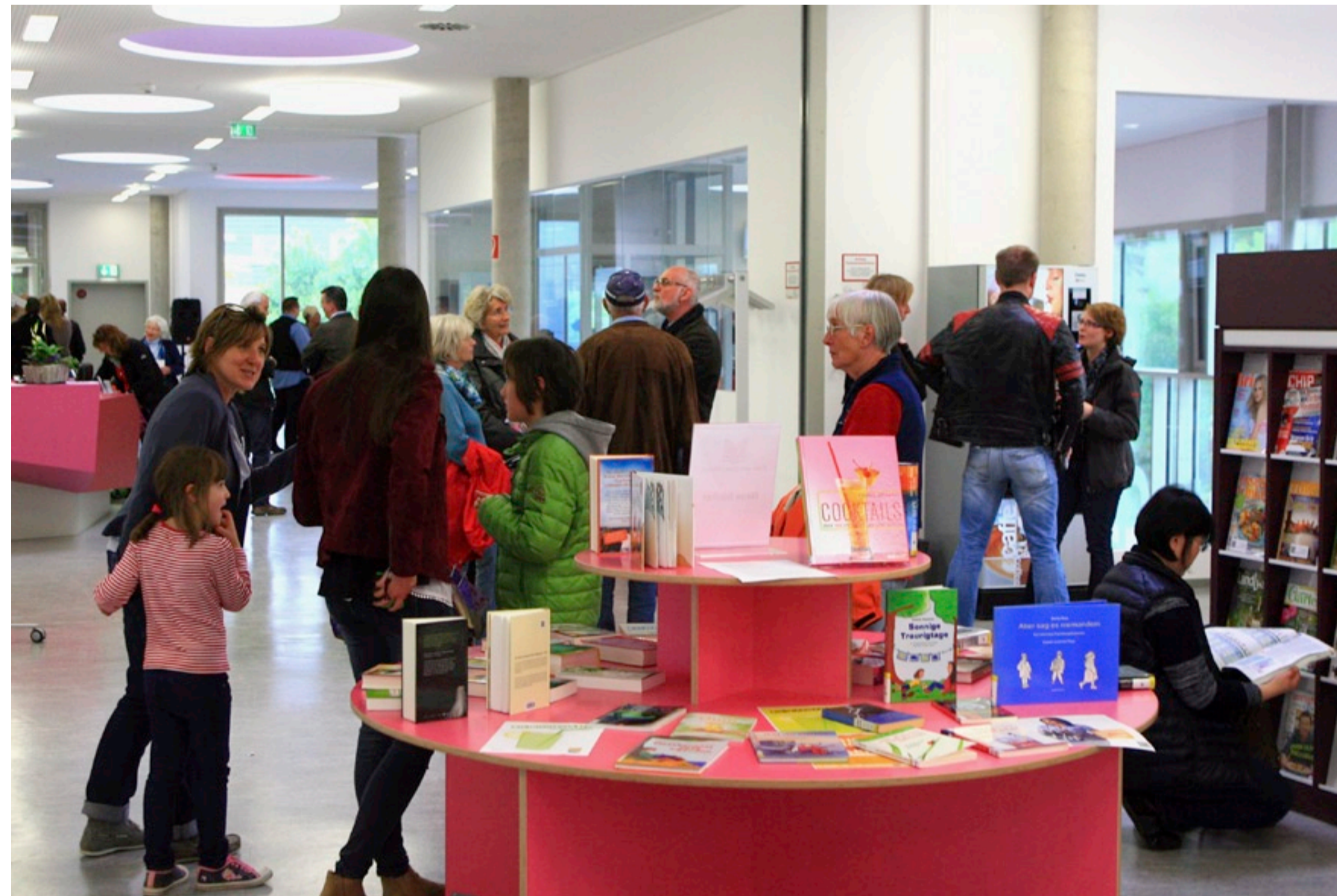
12 Bibliothek im Medienhaus