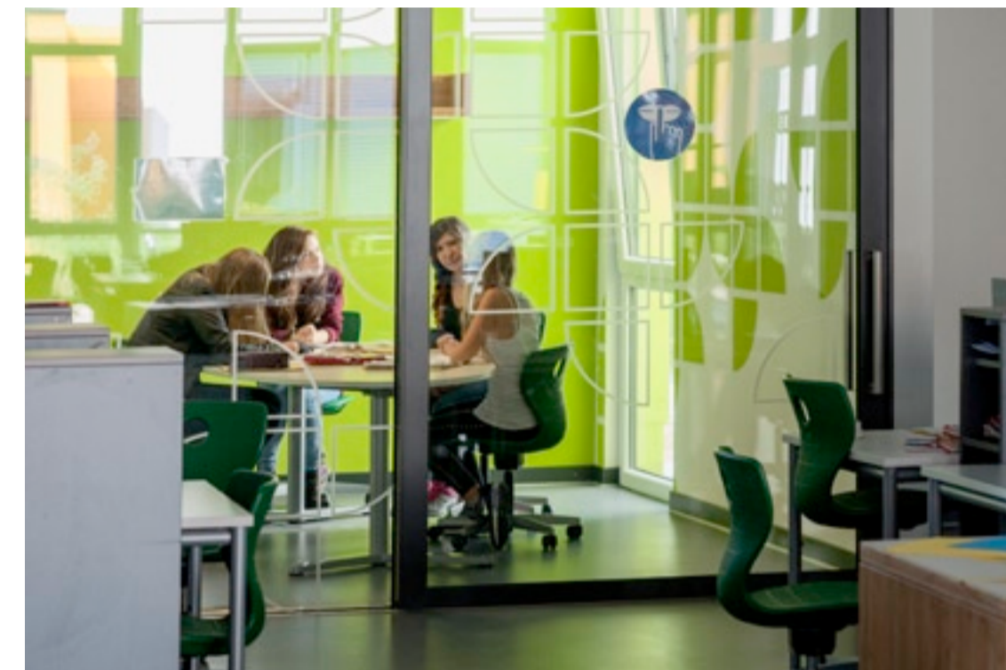
13 Lernlandschaft im Lernhaus